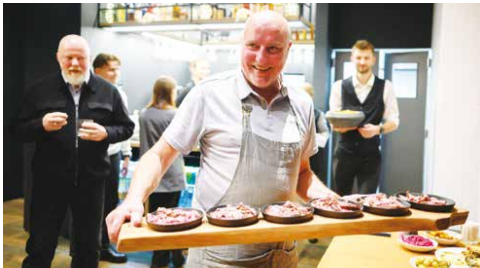
Planuojama, kad „Kepsnių cechą“ dirbs visus metus. Žiemą savaitgaliais – penktadieniais nuo 17 val., šeštadieniais ir sekmadieniais – nuo 12 val.