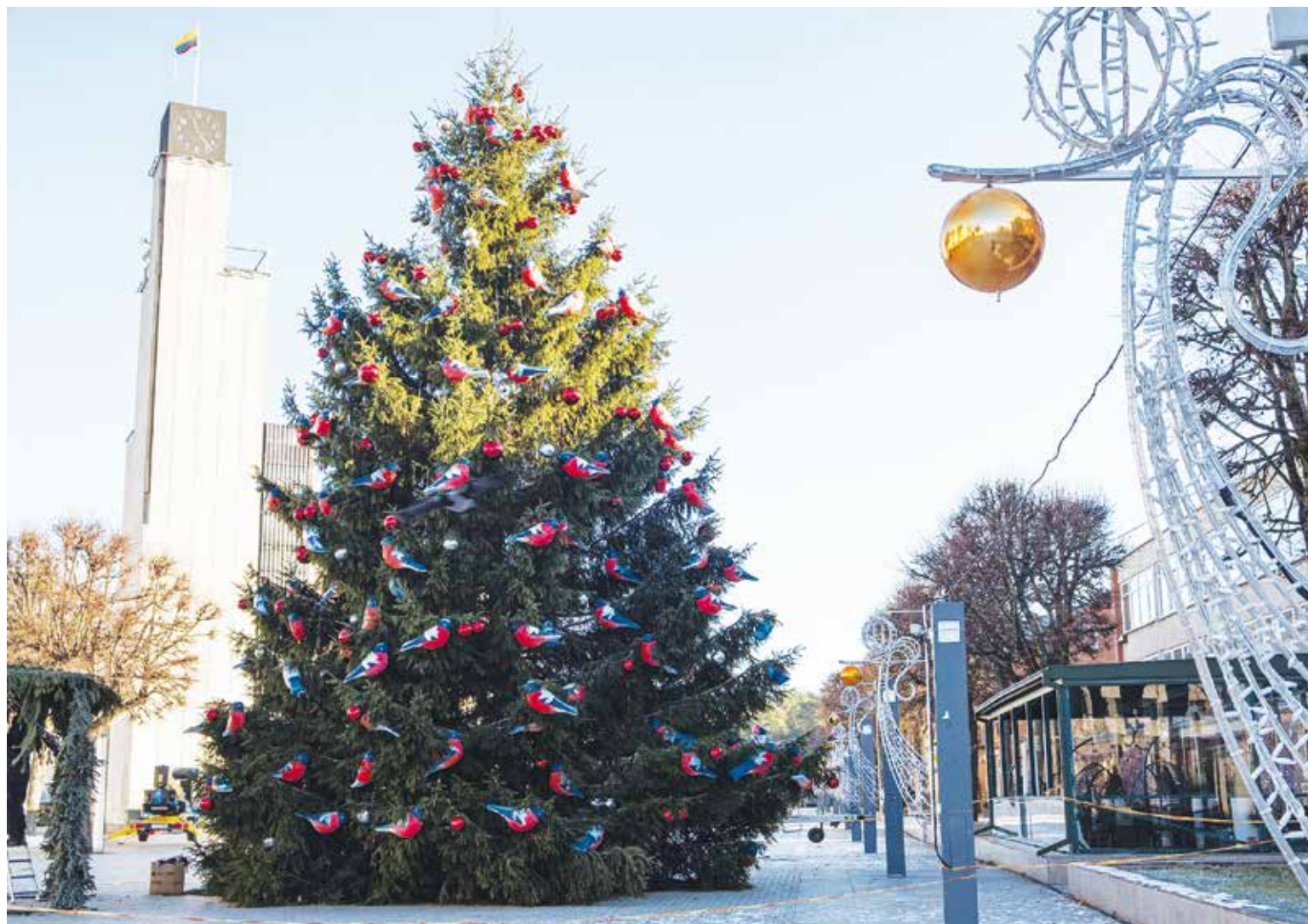
Jau šį penktadienį, gruodžio 1 d., 18 val. Alytaus miesto gyventojai ir svečiai kviečiami į ypač magišką Kalėdų eglutės įžiebimą.