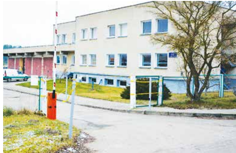
Lazdijų vandens vartotojų ateinančiais metais laukia malonios naujienos. Jei viskas vyks pagal planą, tai jau kitais metais daugelis daugiabučių gyventojų galės džiaugtis išmaniaisiais vandens skaitikliais.